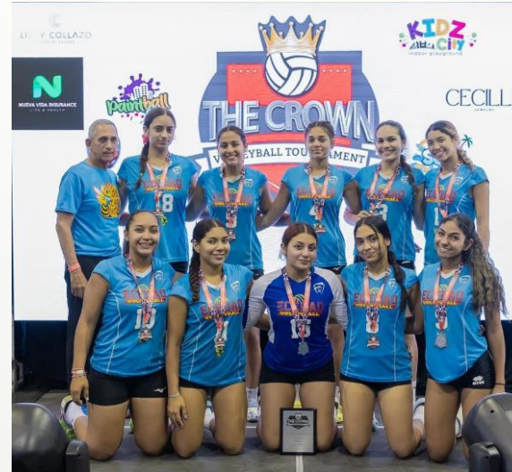
Sub Campeonas 18U